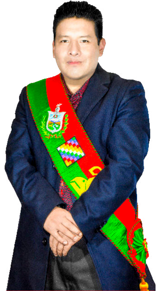
Gobernador: MSc. Santos Quispe Quispe

También se refleja en mejores condiciones de estudio tecnológico y en atención para todos los grupos sociales de nuestra población. El desafío es aún mayor para abrir la posibilidad de que el cambio que vive el departamento sea sostenido y tenga continuidad con obras. Es la visión para que La Paz sea nuevamente líder nacional.